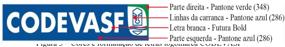
Figura 3 – Cores e formatação de letras logomarca CODEVASF