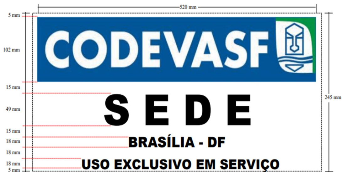
Figura 2 – Dimensões de logomarca para veículos de uso exclusivo em serviço