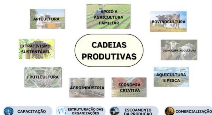
Figura 1 - Algumas das atividades produtivas apoiadas pela Codevasf

Nessa perspectiva, as atividades produtivas são apoiadas e estruturadas, possibilitando sua organização em Arranjos Produtivos Locais (APLs). Os APLs são atividades estruturadas, com um número significativo de empreendimentos no território onde indivíduos atuam em torno de uma atividade produtiva predominante compartilhando formas percebidas de cooperação e algum mecanismo de governança, podendo incluir pequenas, médias e grandes empresas.