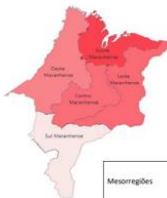
MESORREGIÕES MARANHENSES E PIB PER CAPITA