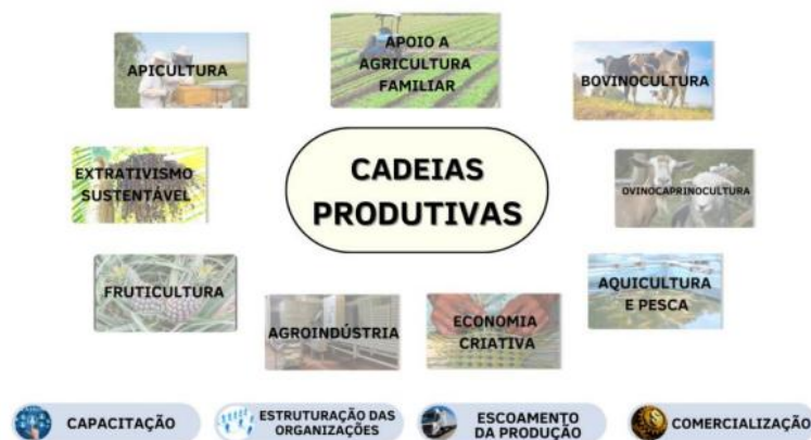
Figura 1 - Algumas das atividades produtivas apoiadas pela Codevasf

promovem melhoria das condições de produção, por sua vez, melhoria das condições de vida da população com geração de emprego e renda, exploração racional e sustentável dos recursos naturais.